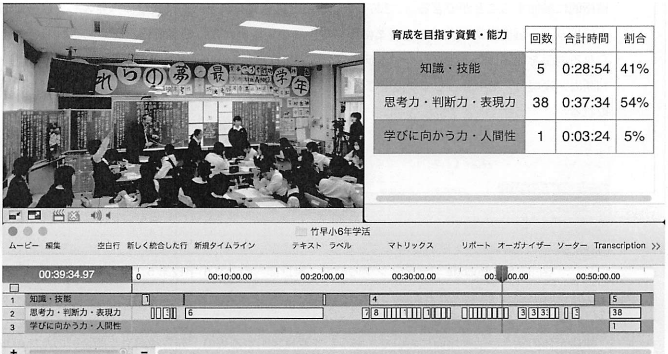
図2 Studiocode コーディングの結果（東京学芸大学附属竹早小学校第6学年学級活動）

学級活動で「評価表現リスト」を活用できるかどうか、第6学年の学級活動（1）の授業を対象に分析を行った。授業は、2016年12月に行われたもので、内容は学級目標の達成度の確認及び改善の話合い活動であった。指導した教員のねらいは「学級の全員がもっと仲良くなれるようにし、決めた学級目標を活かして学校内外で行動でき、自己の将来とのつながりについて考えられるようにする。」であった。班ごとに意見をまとめ、全体で議論し、最後に個人で振り返りをまとめるという展開であった。この授業について、評価表現例によって評価観点を定められると考えられる場面を抽出した。（図2）